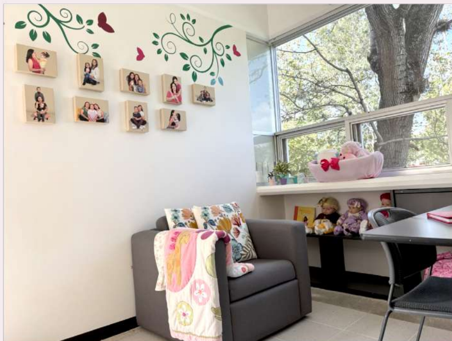
Vista de la Sala de Lactancia en el Instituto de Salud Pública, Universidad Veracruzana.