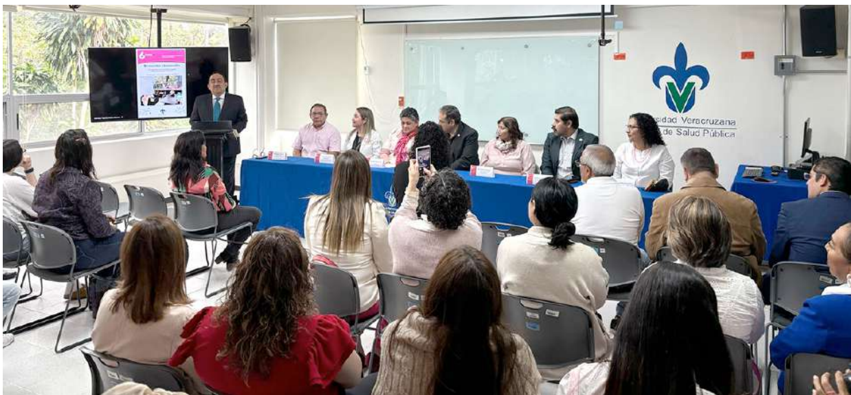
Acto Inaugural de la Sala de Lactancia en el Instituto de Salud Pública. Universidad Veracruzana.

Entonces el llamado a la comunidad universitaria es a diseñar e implementar políticas en sus espacios para la promoción, el apoyo y la protección de la lactancia, apegadas a las recomendaciones de la Organización Mundial de la Salud, así como a incluir contenidos y el desarrollo de habilidades para que los profesionales de la salud apoyen de manera efectiva la práctica de la lactancia materna.