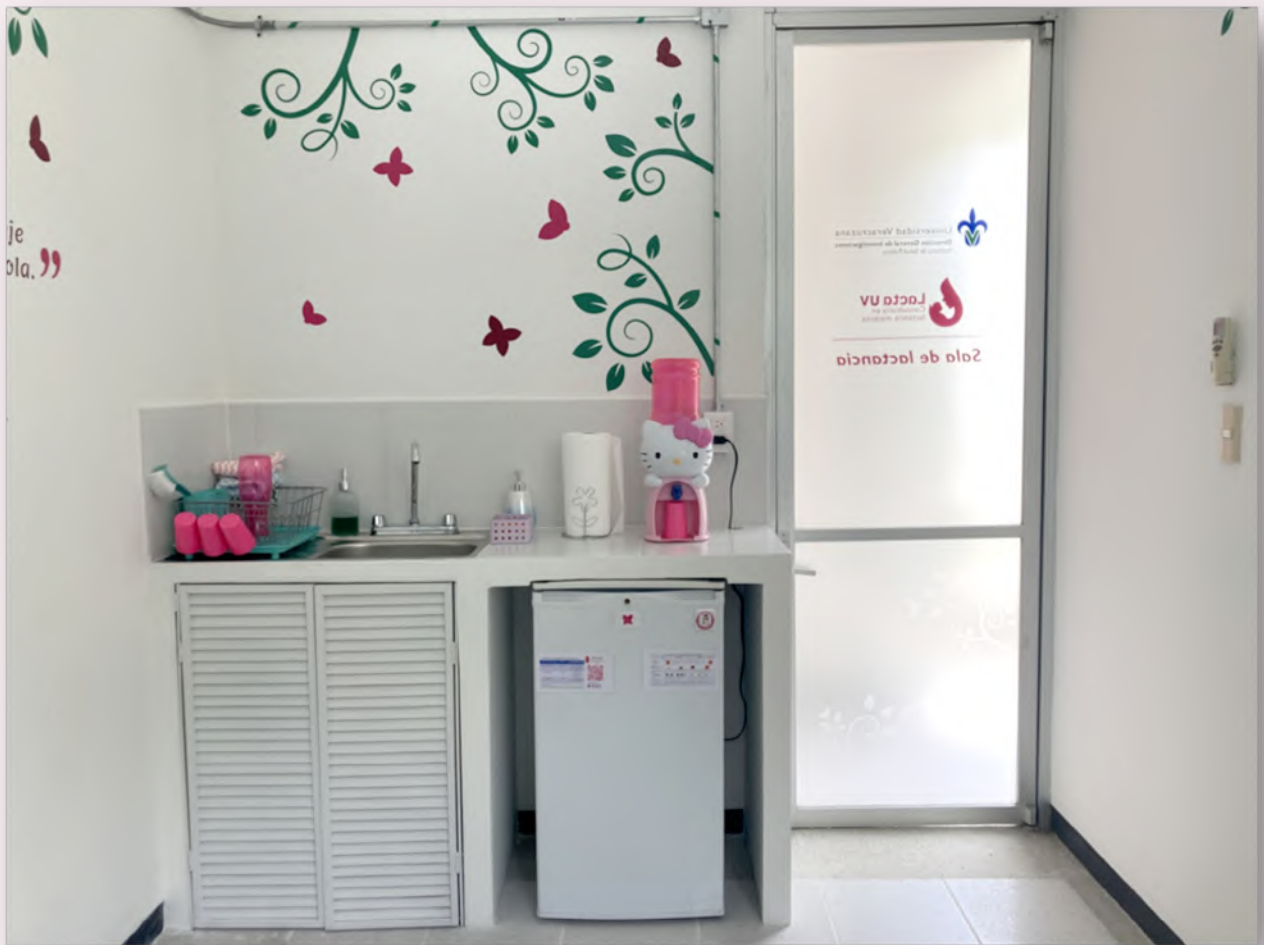
Vista de la Sala de Lactancia en el Instituto de Salud Pública. Universidad Veracruzana.

en el tema de Igualdad sustantiva, inclusión y no discriminación (Aguilar Sánchez, s. f.). En 2024 durante la gira de trabajo de la oficina de rectoría, el Instituto de Salud Pública presentó la sala de lactancia ubicada en sus instalaciones (Figura 2) (Sistema de noticias de la Universidad Veracruzana, 2024). Dicha sala de lactancia cuenta con más implementos de los enlistados en la Ley 866, y se acompaña por servicios de extensión universitaria sin costo, un taller de extracción y manejo de la leche materna, así como consultoría en lactancia materna a través de Lacta UV (Universidad Veracruzana, s. f.).