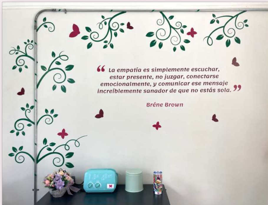
Gráfica y textos diseñados para ambientar la Sala de Lactancia.